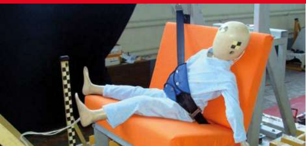
Результаты тестов использования небезопасных удерживающих устройств*

Дополнение определения «направляющая ляжка» в Правилах ЕЭК ООН № 44-04 было одобрено Всемирным Форумом (WP.29). Внесенная поправка к формулировке указывает на то, что « направляющая ляжка рассматривается как составной элемент детской удерживающей системы и НЕ может отдельно официально утверждаться в качестве детской удерживающей системы в соответствии с настоящими Правилами». Это исключает даже формальную возможность сертификации устройств типа «направляющая ляжка»!