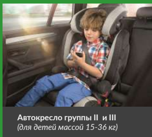
Автокресло группы II и III (для детей массой 15-36 кг)