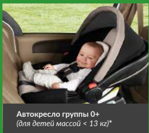
Автокресло группы 0+ (для детей массой < 13 кг)*