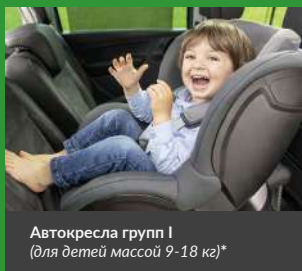
Автокресла групп I (для детей массой 9-18 кг)*