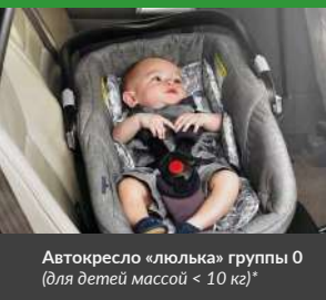
Автокресло «люлька» группы 0 (для детей массой < 10 кг)*

При покупке детского удерживающего устройства обязательно следует уточнить у продавца наличие сертификата на товар!